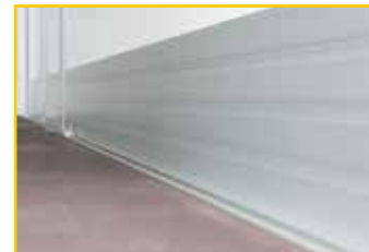
Rammschutzleiste 150 / 300 mm (optional)

Geeignet für alle Fahrgestelle bis 7.49 t von Citroën, Mercedes-Benz, Fiat, Ford, IVECO, MAN, Mitsubishi, Nissan, Opel, Peugeot, Renault, Volkswagen ... und viele mehr!