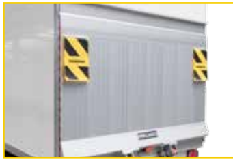
Ladebordwand LBW (optional)