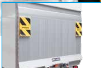
Ladebordwand LBW (optional)