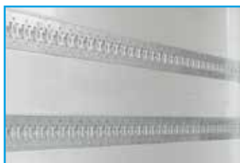
Integrierte oder aufgesetzte Zurrleisten (optional)