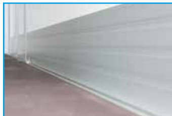
Rammenschutzleiste 150 / 300 mm (optional)